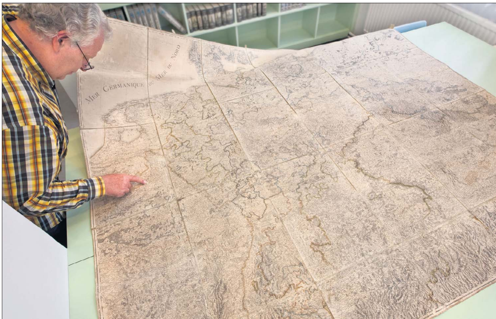
Limburg valt in het niet op de gerestaureerde Franse militaire kaart van het Duitse Rijk. Beneden de naam van de maker.